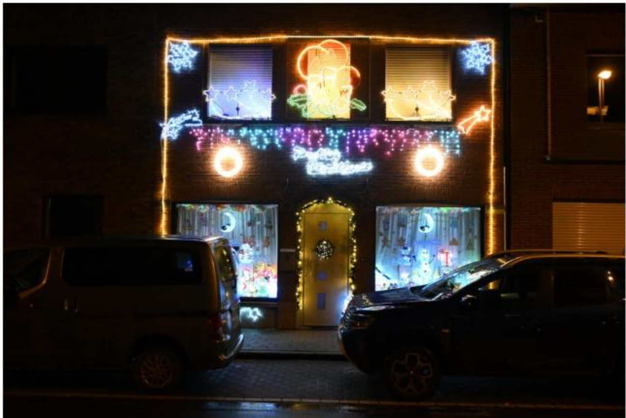
Ook het huis van Belinda in de Koningin Astridlaan valt op.