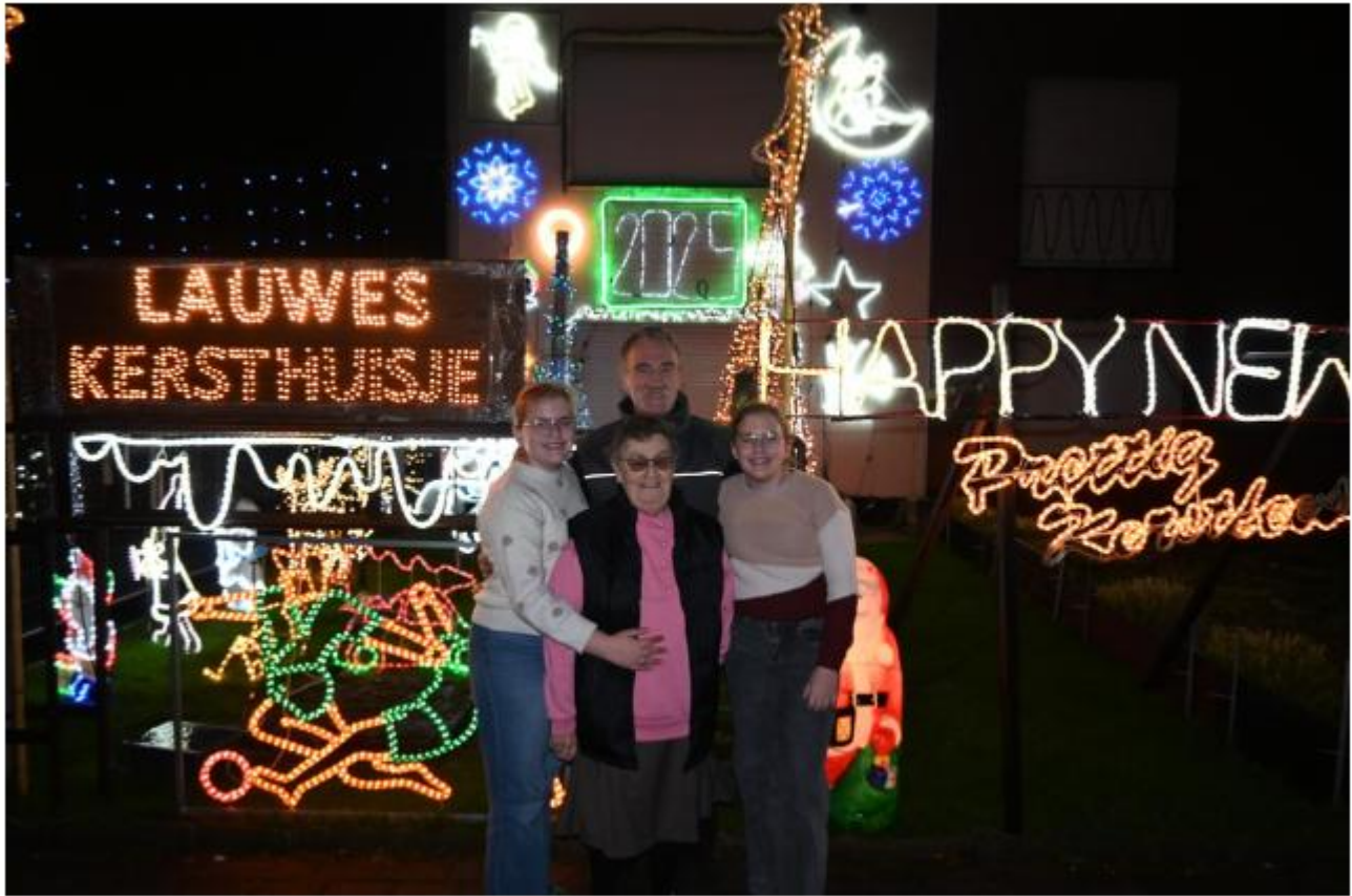
Het Lauwes Kersthuisje is ook dit jaar terug.